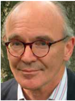
Martin Mosebach

Martin Mosebach, in Frankfurt geboren, arbeitet in den Genres Roman, Hörspiel, Film-Drehbuch, Opernlibretto, Theater, Reportage, Feuilleton und Erzählung. Im Jahr 2007 wurde er mit dem Georg-Büchner-Preis, dem bedeutendsten deutschen Literaturpreis, geehrt. Zur Begründung führte