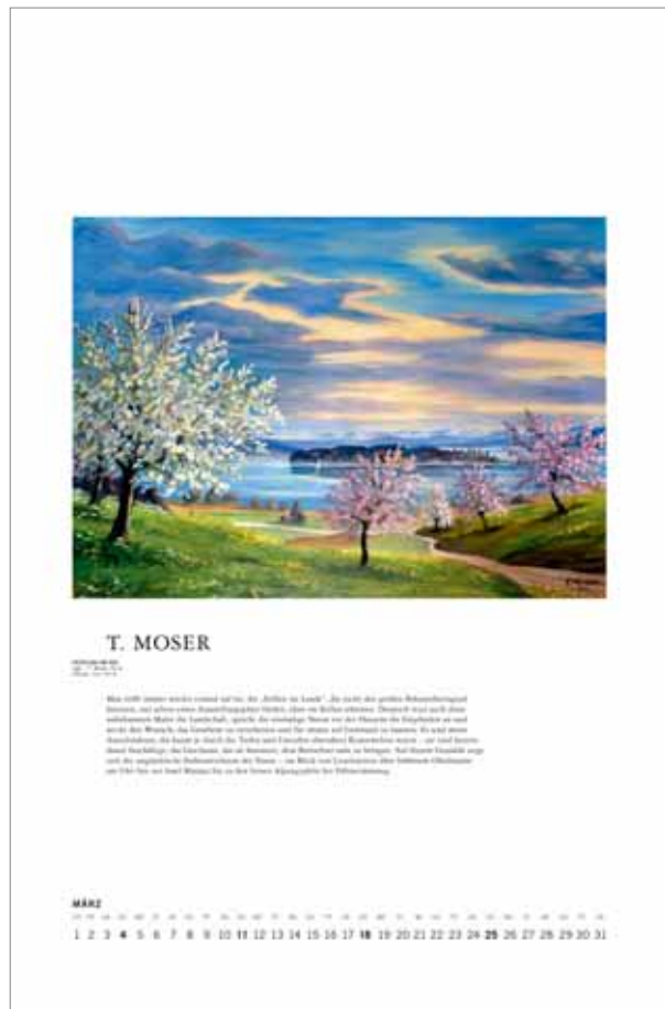
Bilder aus dem Kalender „Maler sehen den Bodensee 2012“