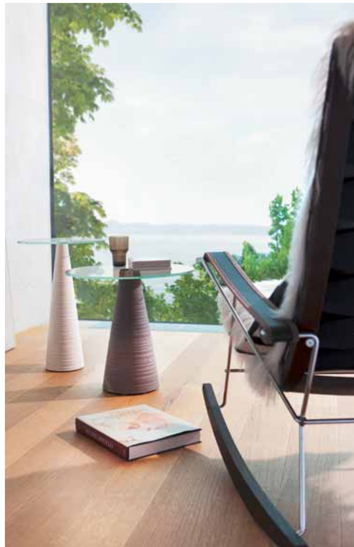
Draenert Studio GmbH, ED