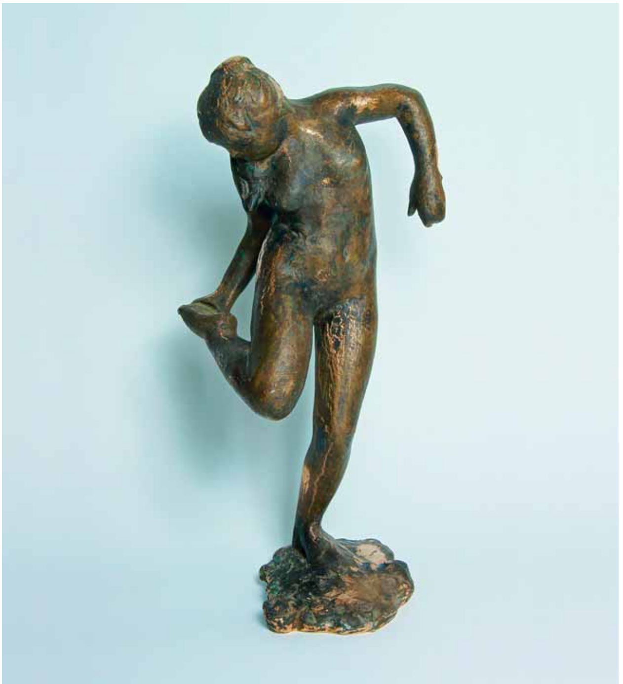
Edgar Degas, Tänzerin, ihre rechte Fußsohle betrachtend: Foto: Thomas Wortman

erste Veranstaltung eingebracht, die für die Euregio Bodensee etwas Neues ist, ein Experiment. Er selbst konnte bei der Vorbereitung und bei der Konzeption, die sich um das Thema „Figur“ rankt, viel Wissen beisteuern, das er aus einem umfangreichem Archiv schöpft, das er im Lauf der Jahre aufgebaut hat. Es beleuchtet entscheidende Epochen insbesondere skulpturaler Entwicklung weltweit.