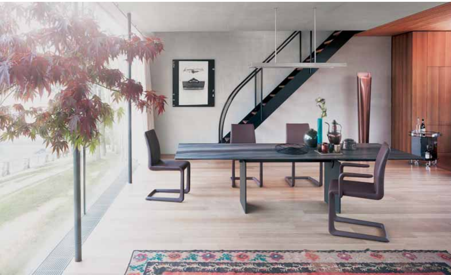
Draenert Studio GmbH, Atlas / Talos

rungen, mit Strukturen und Adern, gezeichnet von der Natur. Steinplatten, die es zu tasten und zu fühlen gilt, um Bekanntschaft zu machen mit dem Stück, das schließlich als Tischplatte das Eigene werden soll.