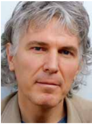
Rolf Lappert

Rolf Lappert, geboren in Zürich, wurde hierzulande vor drei Jahren bekannt, als er für den Roman „Nach Hause schwimmen“ mit dem erstmals verliehenen Schweizer Buchpreis ausgezeichnet wurde. Mit diesem Werk hatte er es auch auf die Shortlist für den Deutschen Buchpreis geschafft, der